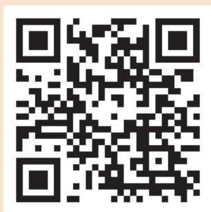
Meniu de Prânz

Află mai multe: Scanează codurile QR de mai jos pentru a accesa informații utile: